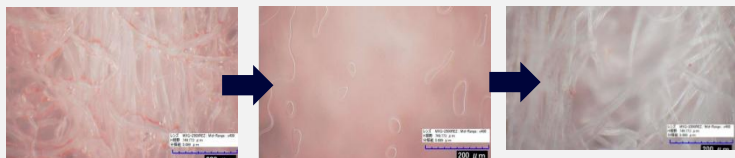
芳香機能性評価試験実施